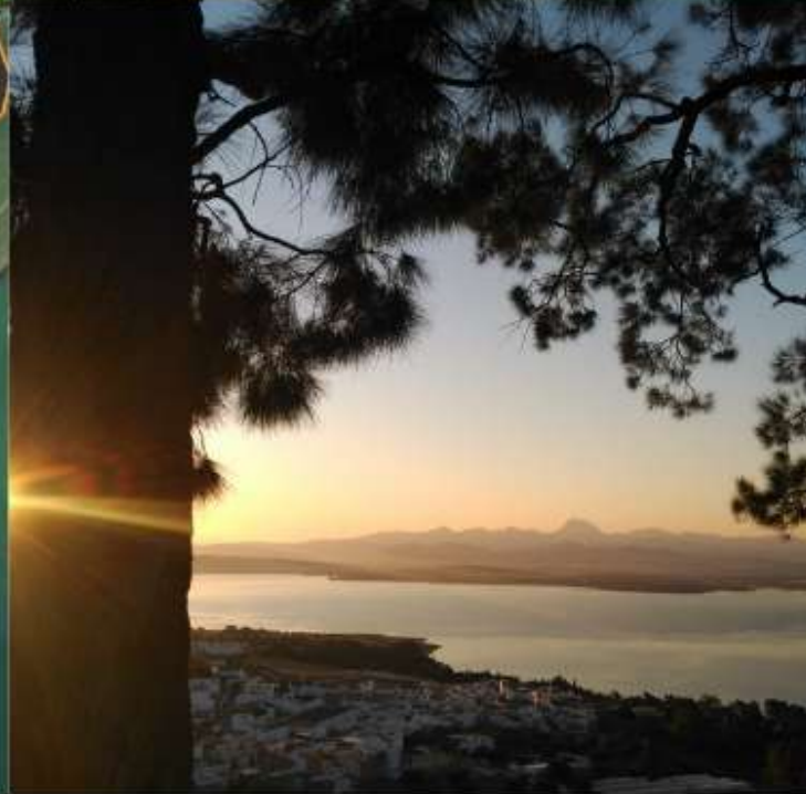
PASEO DE LOS EUCALIPTOS