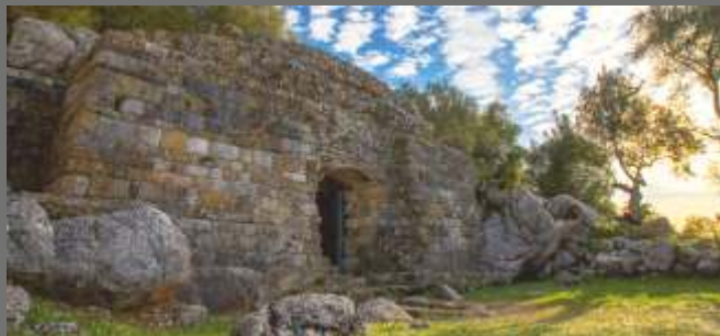
Exterior del Mausoleo