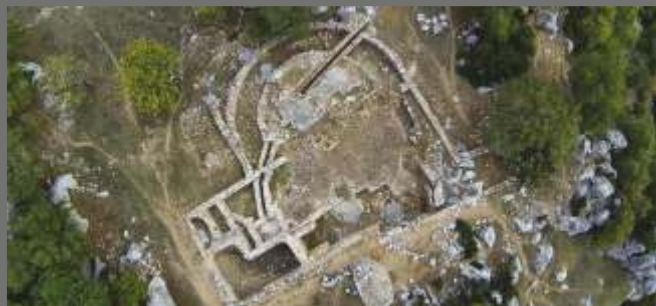
Conjunto de Termas