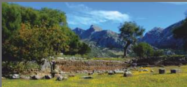
Vista general del Foro